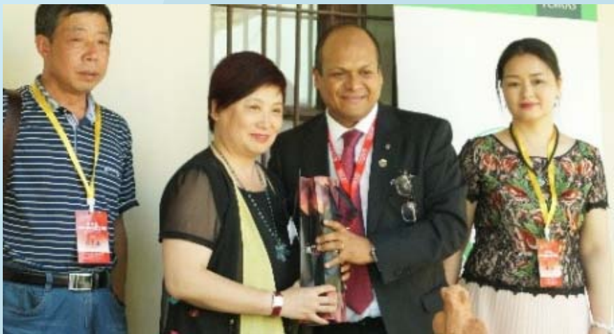
La delegación de artesanos chinos se hizo presente en la inauguración realizada en la municipalidad de Machalí.