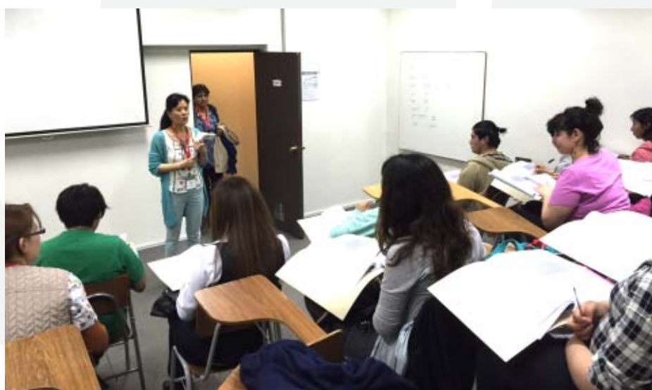
Miembros del curso de chino mandarín pertenecientes al nivel básico 1.

En materia cinematográfica se han llevado a cabo tres ciclos de cine chino. El primero durante el año 2015 y dos durante 2016: uno en el marco del Ciclo Internacional de Cine organizado por la sede y el segundo en el Centro Cultural de Osorno. Las tres actividades gratuitas contaron con una excelente recepción del público principalmente por tratarse de films que han sido éxitos de taquilla en Asia y de difícil acceso en nuestro país, como “Perdidos en Tailandia”, “Camino a casa” y “Paraíso Oceánico”. A lo anterior se suma la exhibición de la película “Confucio”, con motivo de la celebración del Día del Instituto Confucio.