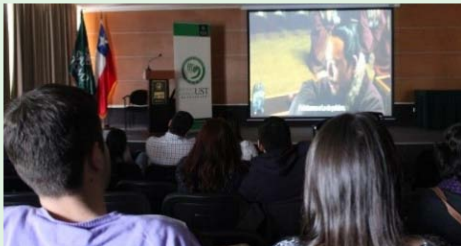
24 personas asistieron a ver la película “Confucio” exhibida en el Aula Magna de la sede.

del marco de la celebración del Día Mundial del Instituto Confucio se exhibió la cinta “Confucio”. Además, en el mes de diciembre se realizó el 1º Ciclo de Cine Chino en la Biblioteca Mall Plaza de la ciudad, donde se exhibieron las películas “Juntos”, “El Cartero de la Montaña” y “Atrapada en la Web”; las que tuvieron una convocatoria de 39 personas.