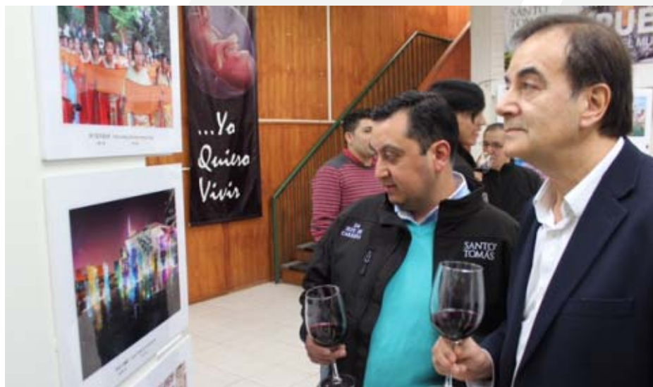
La exposición “La Moda China” fue vista por más de mil personas en el hall de la sede de Santo Tomás.

Sin duda la actividad que marcó un antes y un después fue la presentación del grupo artístico de la Universidad Normal de Hebei, ya que por primera vez una agrupación china realiza un espectáculo de nivel internacional en la ciudad. El evento fue todo un éxito y congregó a más de 500 personas de forma gratuita en el Teatro Municipal de Punta Arenas.