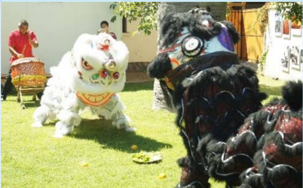
La danza del León del Sur a cargo del Club Arte Oriente de Olmué fue parte de la ceremonia.

Esta sede exhibió en el año 2014 la muestra “Manos de China Milenaria”, compuesta por diversas obras de bordados y brocados chinos. En 2016 se realizaron 3 ciclos de cine chino; uno en la localidad de Coya, otro en Machalí y el último en las dependencias de la sede Santo Tomás. Cada ciclo contó con la exhibición de cuatro películas, las que fueron muy bien recibidas por el público. En 2017 se presentó una segunda exposición, que al igual que la primera muestra, fue donada al IC por la Embajada de la República Popular China en Chile llamada “Memorias de la República”. Junto con lo anterior, la sede participó en la celebración mundial del Día del Instituto Confucio, con el rodaje de la película “Confucio”, ocasión que reunió a más de 40 personas.