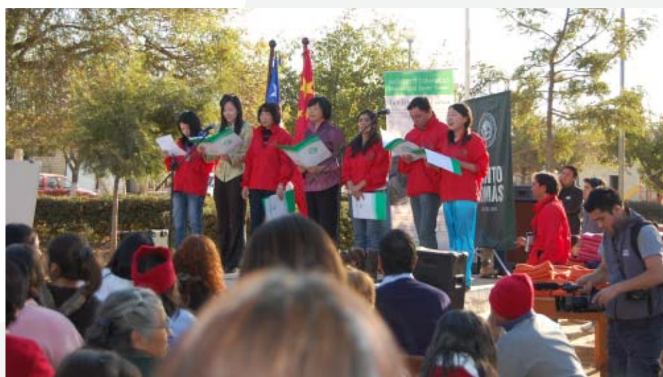
En 2010 el equipo y alumnos del IC UST realizaron la actividad “Sauzal tú puedes” en apoyo a los damnificados del terremoto.