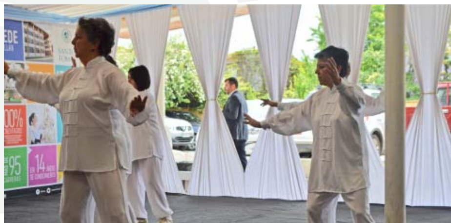
Alumnos de taichí realizaron una demostración durante la inauguración.

Dentro de las actividades culturales, destaca la exhibición de dos exposiciones: “Manos de China Milenaria” y “45 Años de relaciones diplomáticas entre China y Chile”, muestras que fueron visitadas por más de 3.000 personas. Además la sede impulsó el desarrollo de la celebración del Día Mundial del IC, que se festejó con el rodaje de la película Confucio, función a la que acudieron 40 personas.