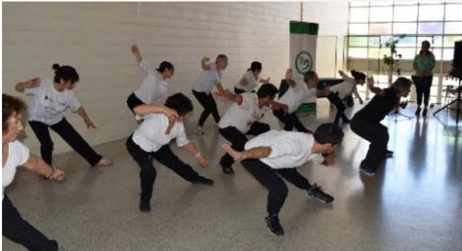
El taller de taichí se desarrolló dos veces por semana durante el segundo semestre de 2016.