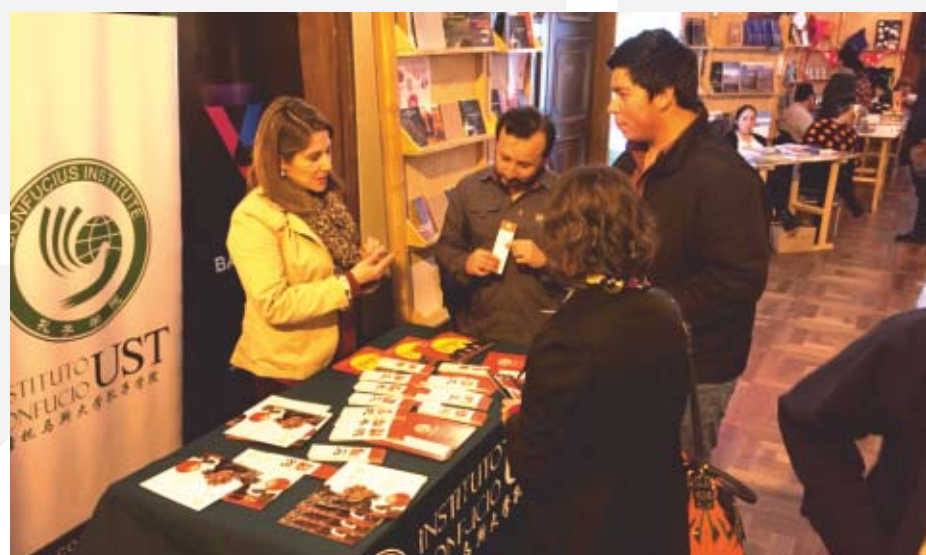
Stand Confucio presentado en el marco de la Feria del Libro y las Artes de Osorno.

“ En el año 2015, el poeta Yu Jian, escritor y miembro de la Asociación de Escritores de China y uno de los nombres de mayor prestigio dentro de la llamada “tercera generación” de poetas chinos, dictó una conferencia en las dependencias de la sede ”