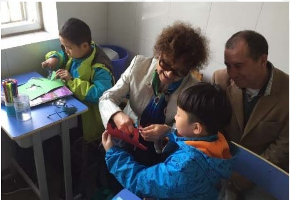
La rectora Santo Tomás Arica, compartiendo junto a estudiantes chinos durante el Campamento de Verano de educadores.