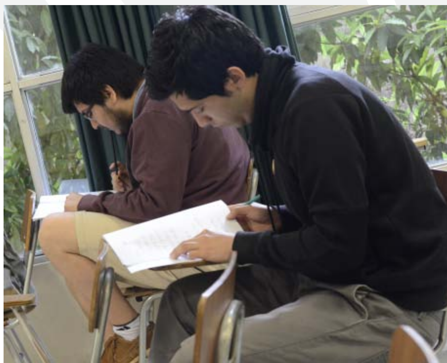
A la fecha 79 alumnos han rendido el HSK y HSKK. Este examen se rinde en la sede desde el año 2011.