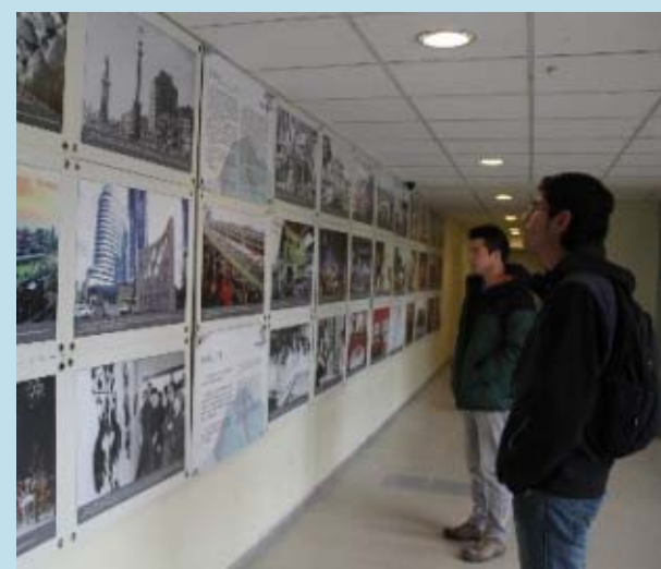
En el año 2015 se exhibió en las dependencias de la sede la exposición fotográfica "Impresiones de Shanghai".