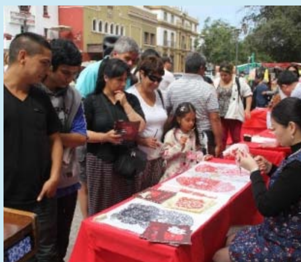
Los artesanos chinos llamaron la atención de los transeúntes con sus trabajos milenarios.