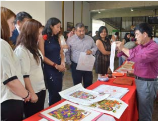
Los artesanos de Henan exhibieron sus trabajos en las dependencias de la sede.