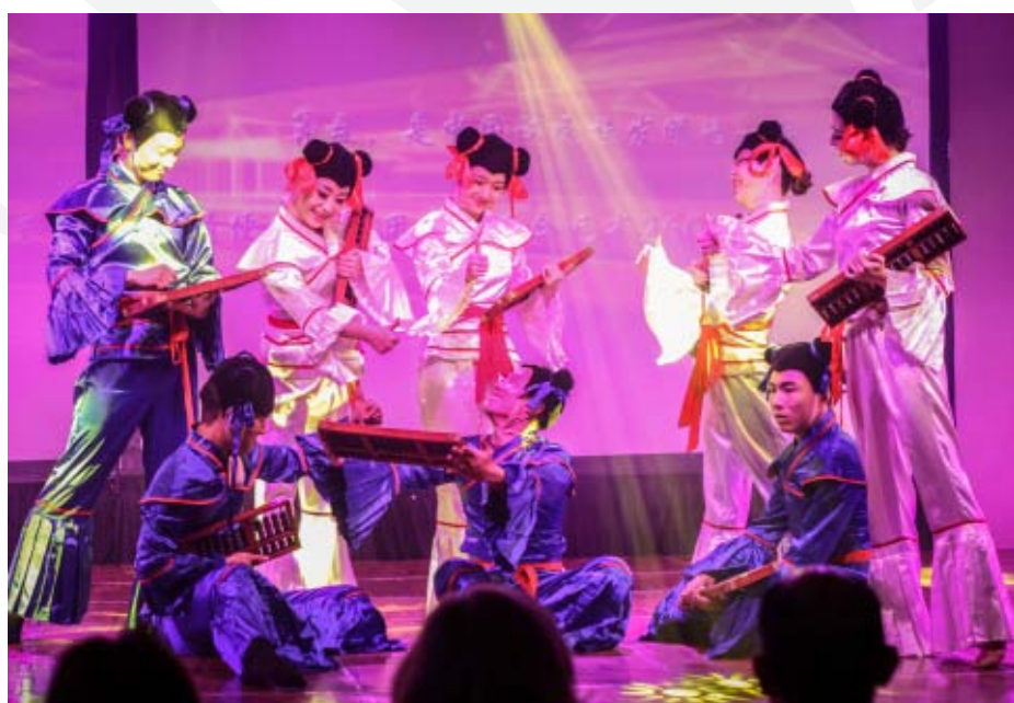
Más de 200 personas llegaron al Hotel Dreams de para ver la presentación del grupo artístico Hebei.