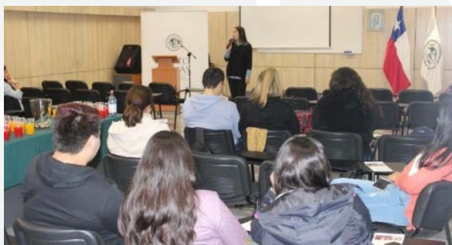
El curso introductorio al chino mandarín contó con 25 inscritos.