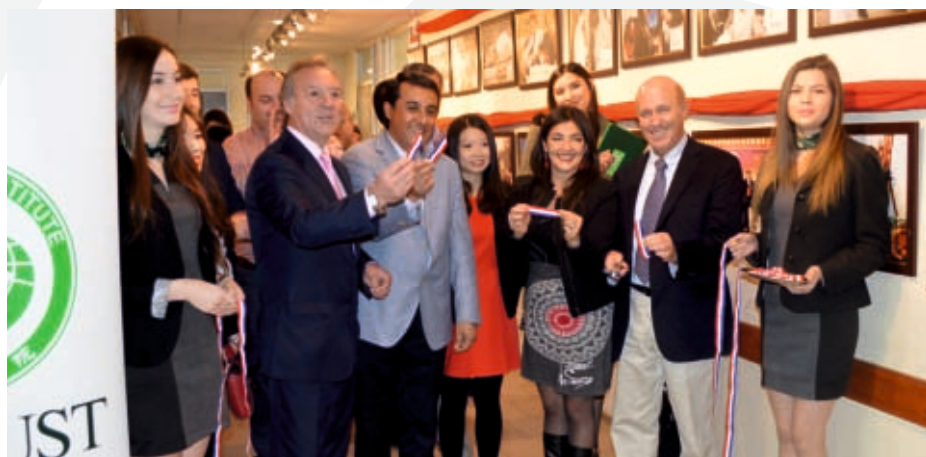
Autoridades oficializan el corte de cinta para dar la bienvenida al Instituto Confucio UST en Chillán. De fondo la exposición fotográfica “45 Años de relaciones bilaterales entre China y Chile”.