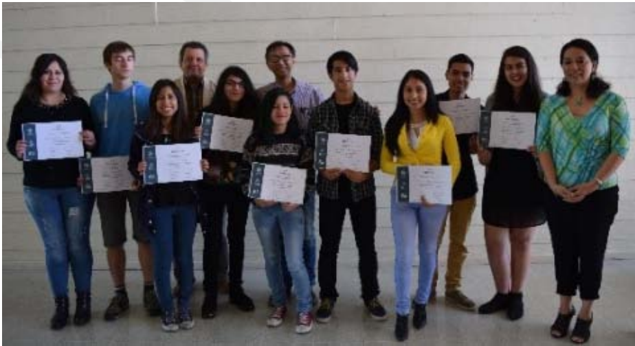
Alumnos reciben su certificación por haber aprobado el curso Básico 1.