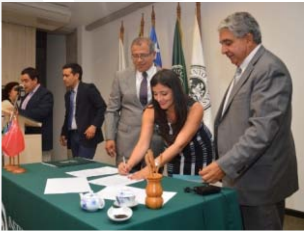
Durante la inauguración se realizó la firma de convenio con el municipio local para difundir el idioma y la cultura china.