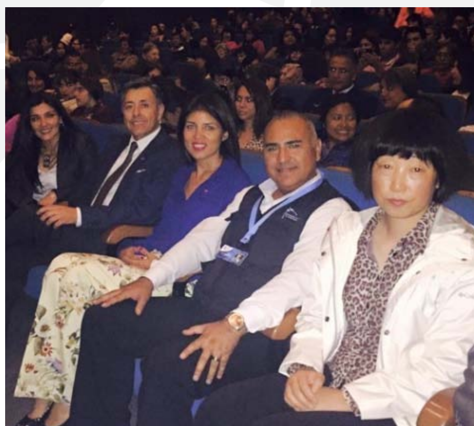
Autoridades municipales en el Teatro Municipal de Antofagasta durante la presentación del grupo de la Universidad de Anhui.