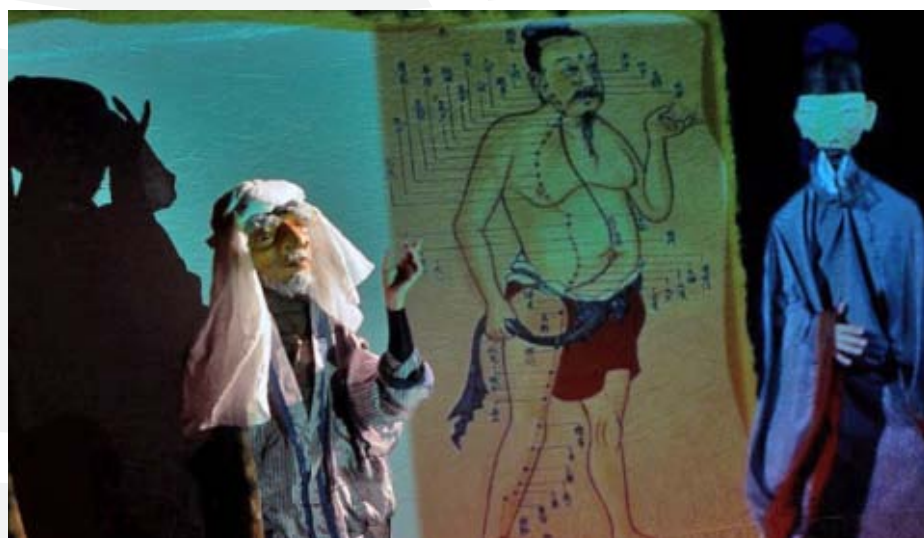
La obra Zheng He, la llegada de los barcos dragón, durante su presentación en el Salón Tarapacá de Iquique.