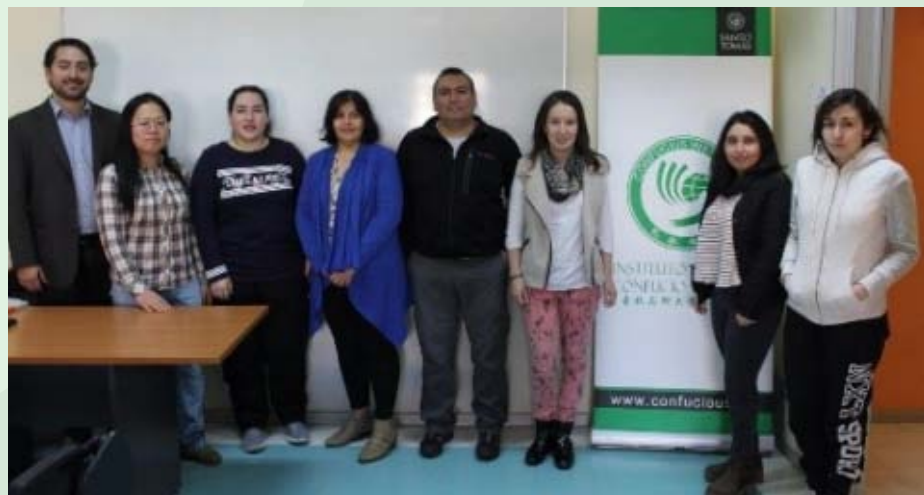
Alumnos del curso Básico 1 durante su primera clase.