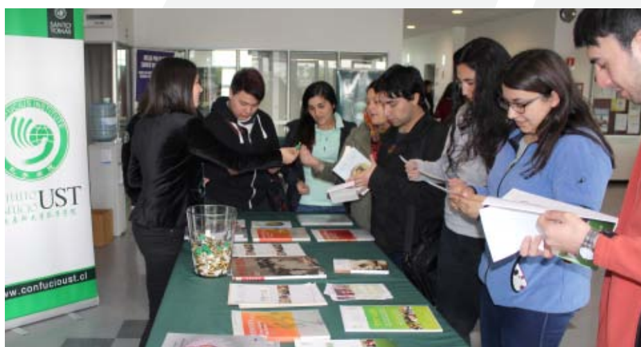
Para la celebración Día Mundial del IC se exhibió la película “Confucio” y se montó un stand informativo que los asistentes a la actividad pudieran conocer más acerca de los cursos y actividades.

Además, en 2016 se desarrolló el 1º Ciclo de Cine Chino, en el que se exhibieron las películas “Si no eres sincera no molestes”, “Camino a casa”, “Caballo Salvaje de Shangri La” y “El mensaje”; las que tuvieron una convocatoria de 55 personas.