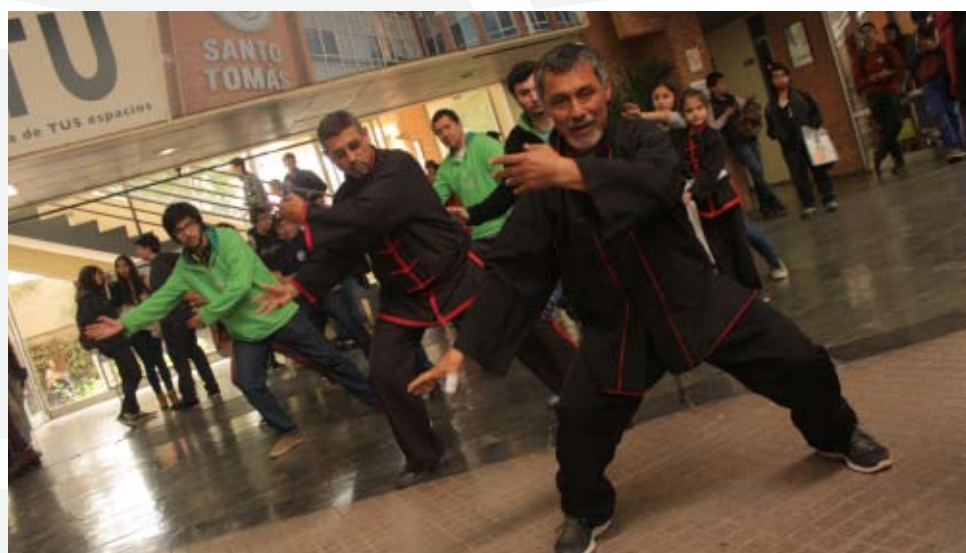
El taller de taichí se desarrolló al interior de la sede con la participación de alumnos de diversas carreras.

En el marco de la celebración del Día Mundial del Instituto Confucio, se realizó la exhibición de la película Confucio en el Auditorio del Liceo Marta Donoso Espejo, que contó con la asistencia de más de 200 personas.