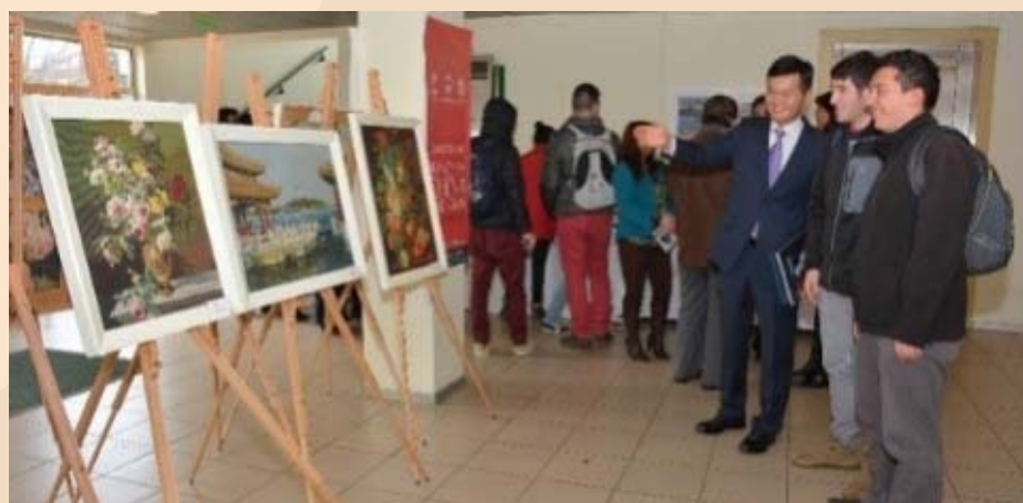
Las exposiciones se exhibieron en el hall de la sede y fueron vistas por miles de personas entre estudiantes y público en general.