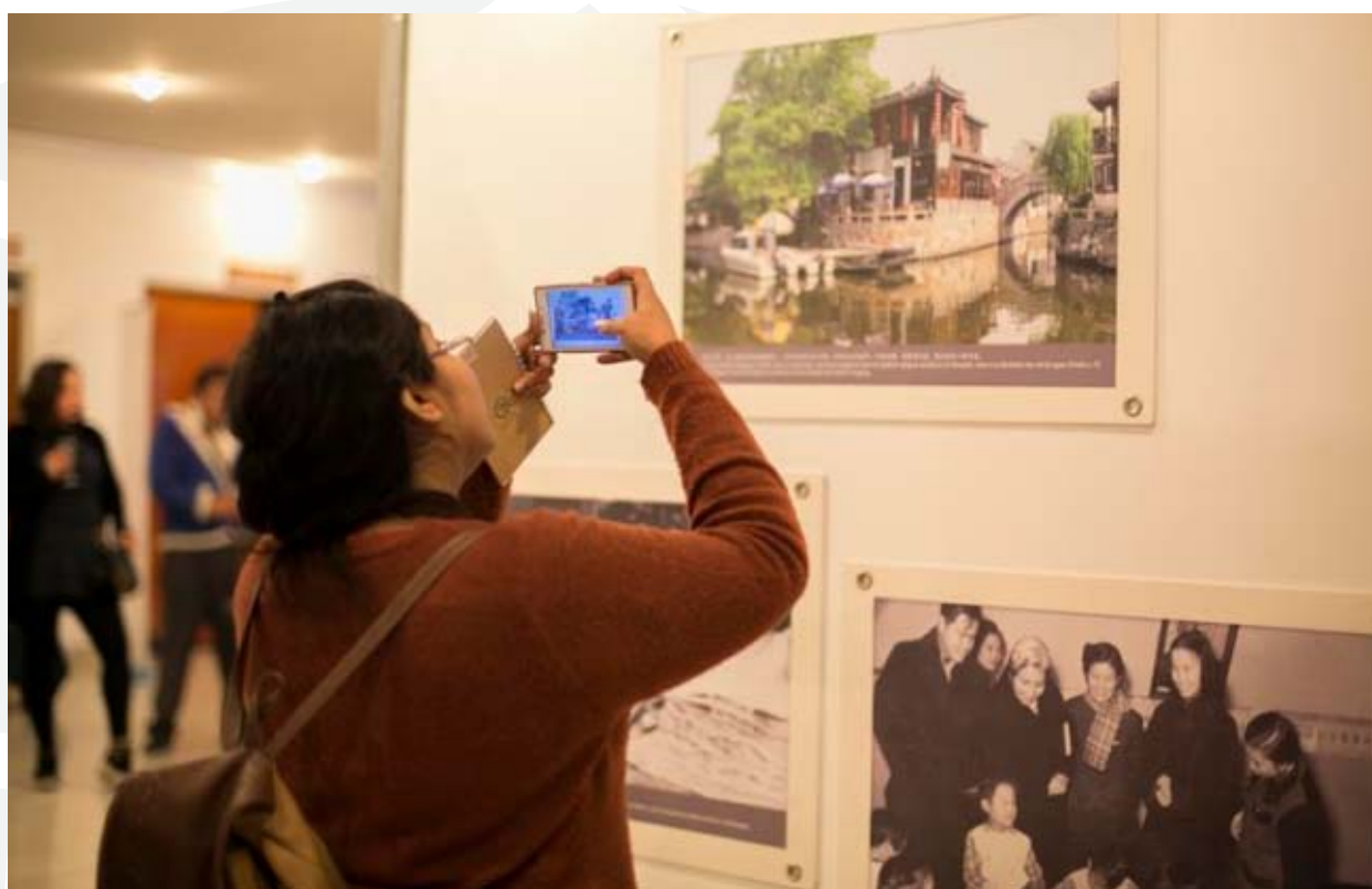
La exposición “Impresiones de Shanghai” se exhibió en el Teatro Municipal de Antofagasta y fue visitada por más de 1.500 personas.