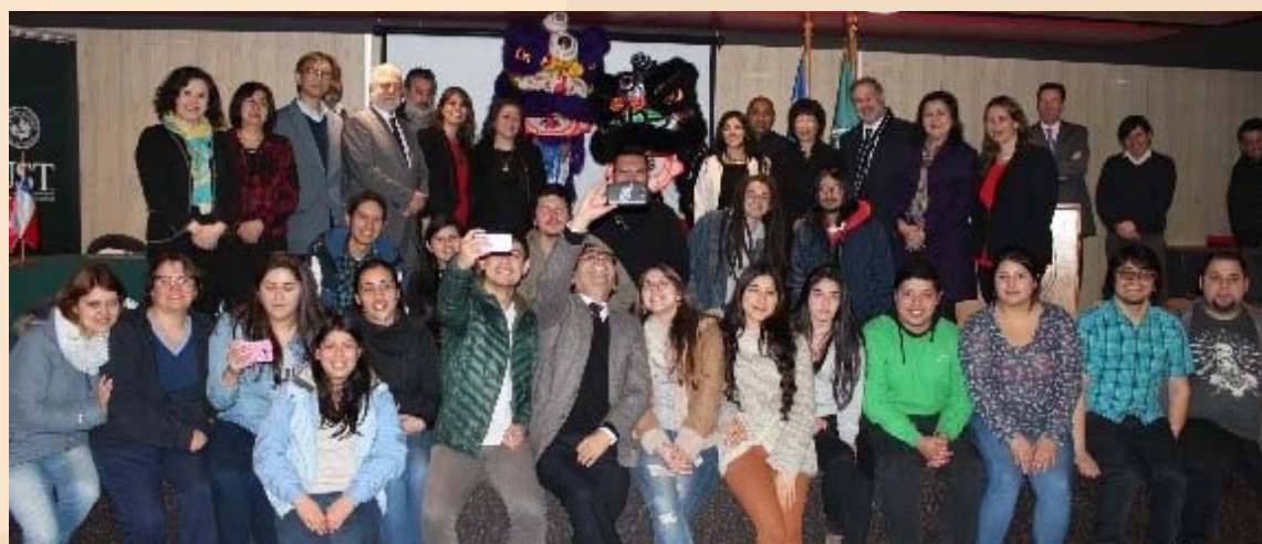
Autoridades, docentes y alumnos fueron parte de la inauguración del IC.