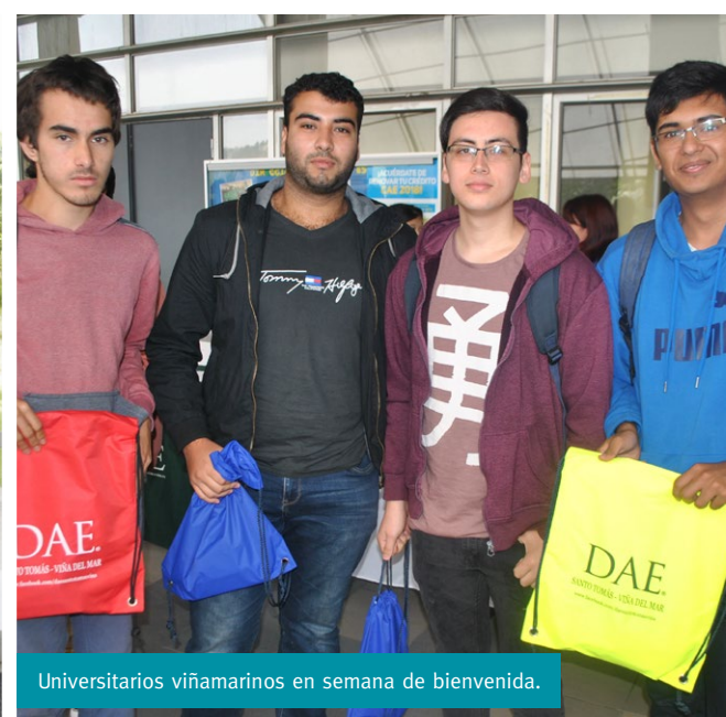
Universitarios viñamarinos en semana de bienvenida.