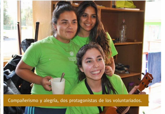
Compañerismo y alegría, dos protagonistas de los voluntariados.