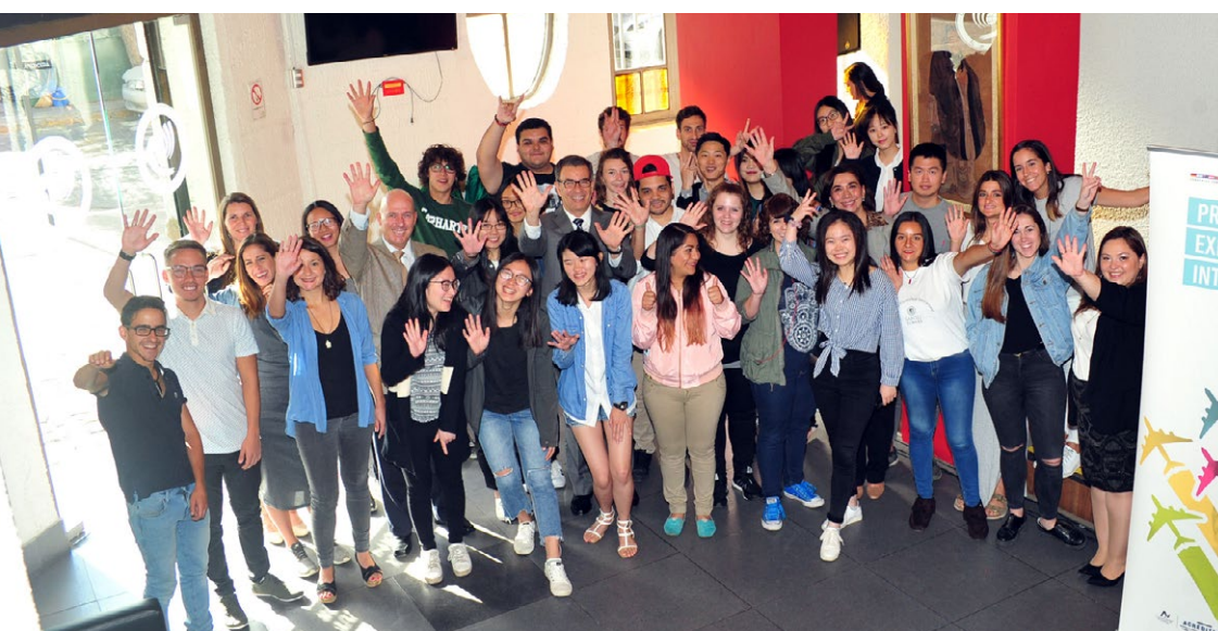
Los estudiantes extranjeros en su bienvenida a Santo Tomás.

Más de 40 jóvenes provenientes de todo el mundo se integraron a las distintas carreras que ofrece la Institución a través del Programa de Experiencia Internacional.