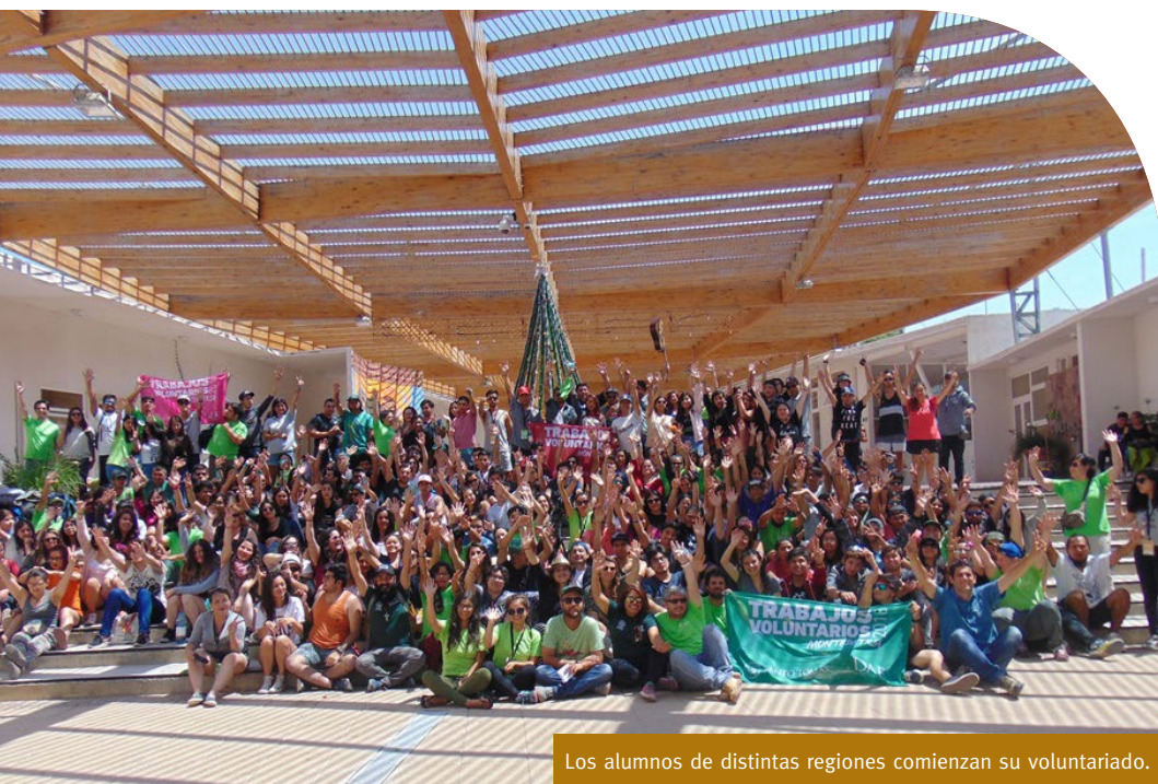
Los alumnos de distintas regiones comienzan su voluntariado.

Los estudiantes desplegaron su ayuda en Monte Patria –IV región– y en Mulchén –VIII región–, ambas localidades caracterizadas por sus altos índices de vulnerabilidad.