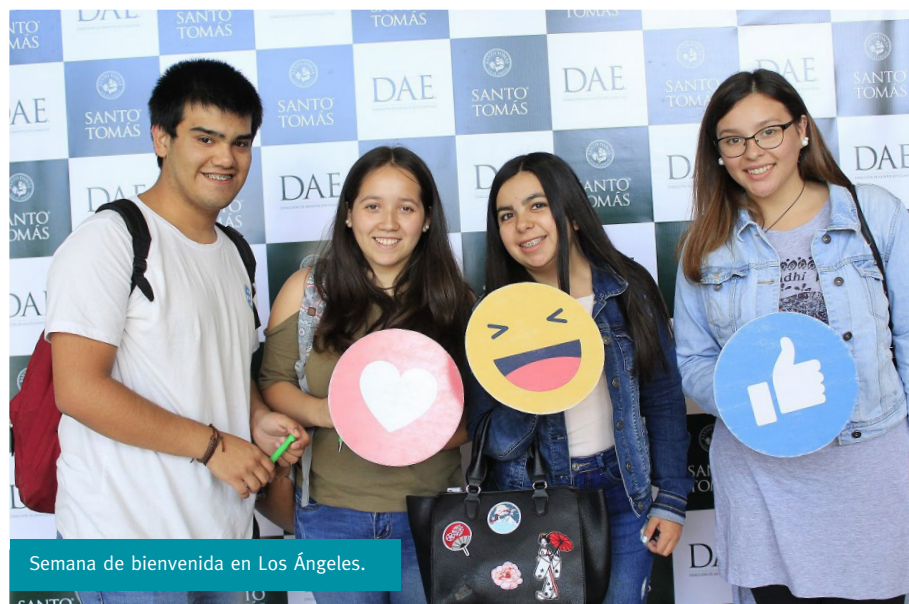
Semana de bienvenida en Los Ángeles.