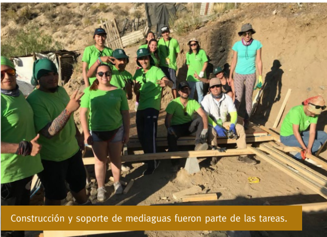
Construcción y soporte de mediaguas fueron parte de las tareas.