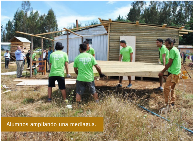
Alumnos ampliando una mediagua.