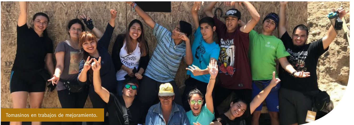
Tomasinos en trabajos de mejoramiento.