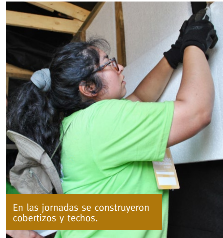
En las jornadas se construyeron cobertizos y techos.