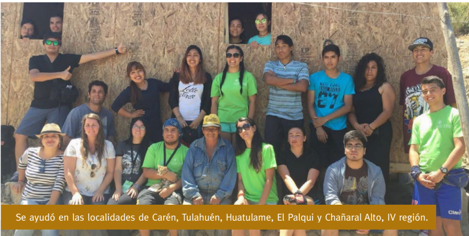
Se ayudó en las localidades de Carén, Tulahuén, Huatulame, El Palqui y Chañaral Alto, IV región.