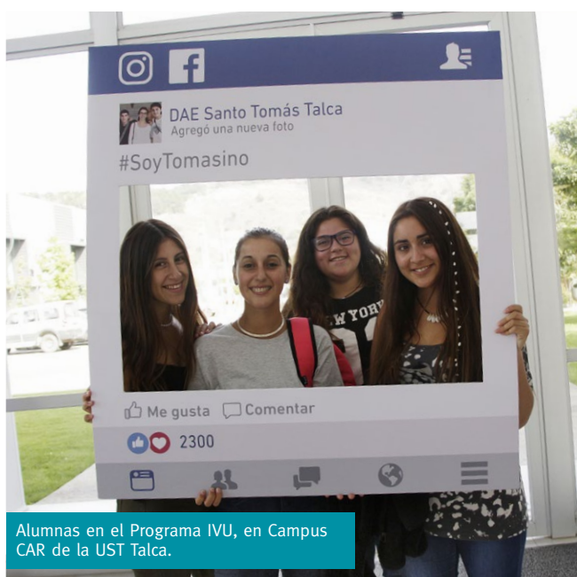
Alumnas en el Programa IVU, en Campus CAR de la UST Talca.