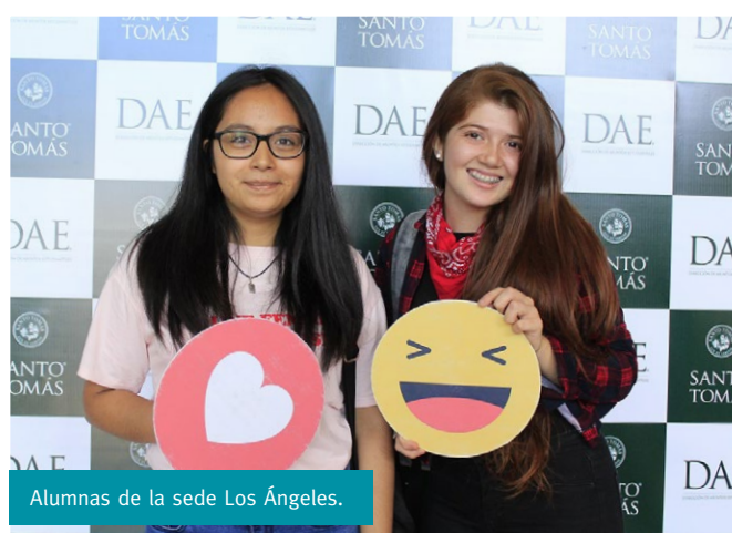
Alumnas de la sede Los Ángeles.