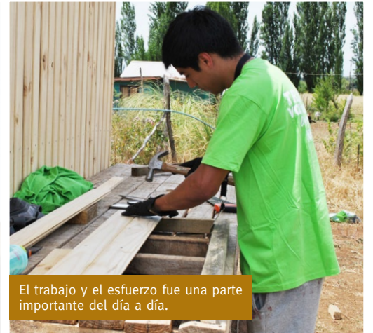
El trabajo y el esfuerzo fue una parte importante del día a día.