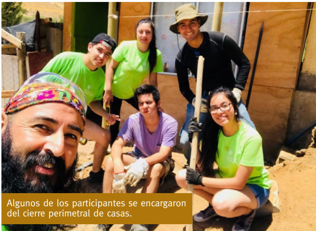
Algunos de los participantes se encargaron del cierre perimetral de casas.