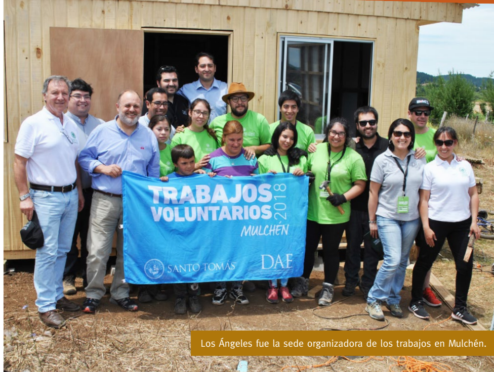
Los Ángeles fue la sede organizadora de los trabajos en Mulchén.