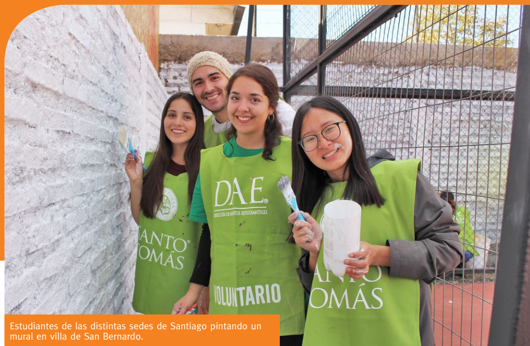
Estudiantes de las distintas sedes de Santiago pintando un mural en villa de San Bernardo.