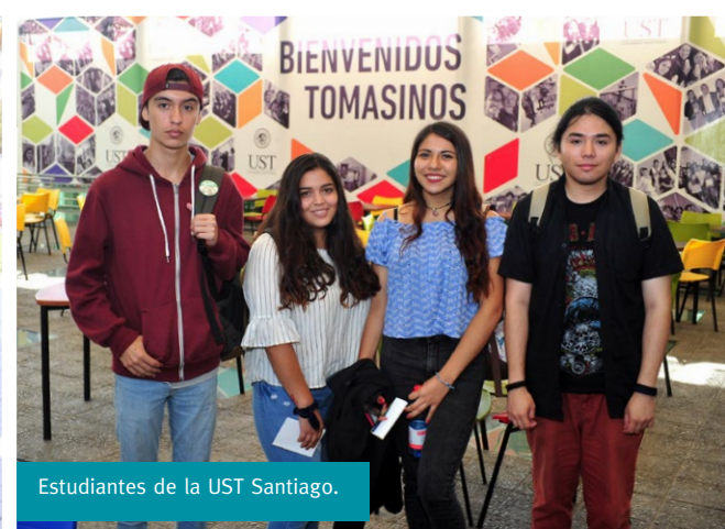
Estudiantes de la UST Santiago.