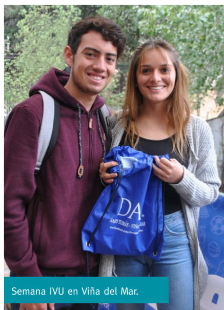
Semana IVU en Viña del Mar.