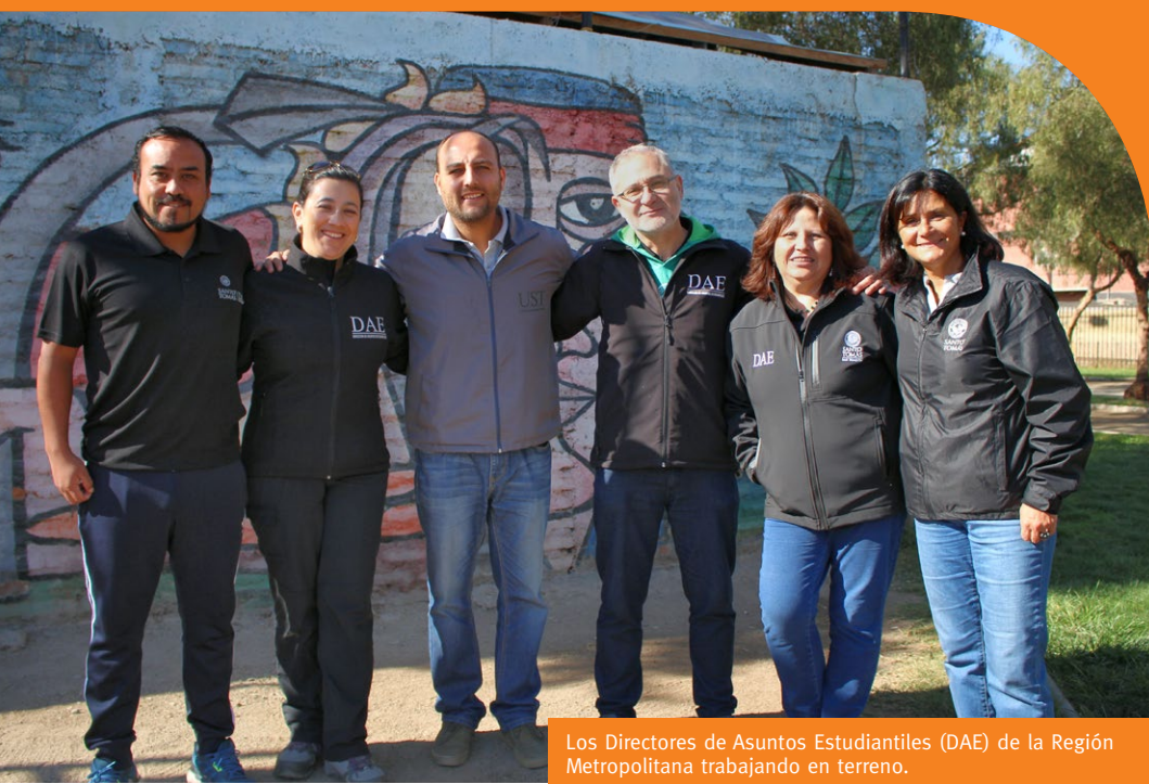
Los Directores de Asuntos Estudiantiles (DAE) de la Región Metropolitana trabajando en terreno.

A lo largo del país, los tomasinos apoyaron a la comunidad con iniciativas que buscaron mejorar la calidad de vida de personas que viven en sectores de riesgo social.