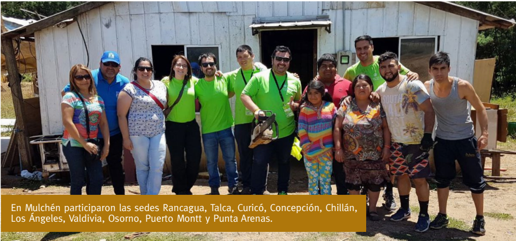
En Mulchén participaron las sedes Rancagua, Talca, Curicó, Concepción, Chillán, Los Ángeles, Valdivia, Osorno, Puerto Montt y Punta Arenas.