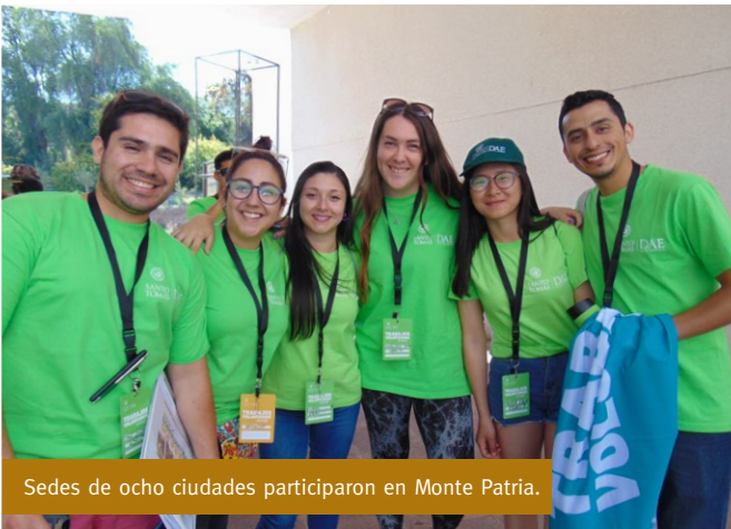
Sedes de ocho ciudades participaron en Monte Patria.