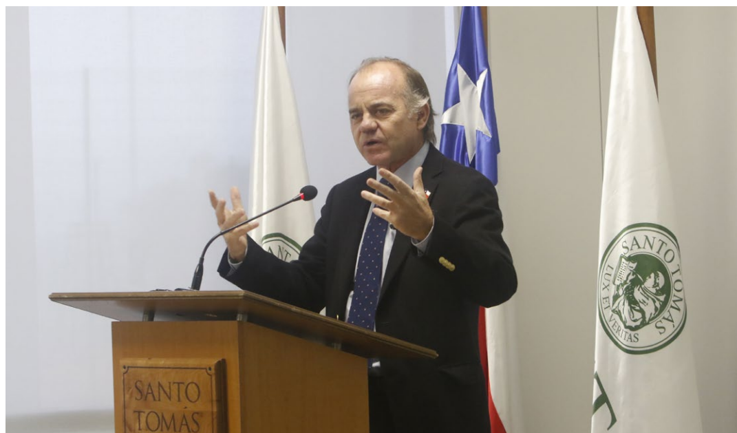
Charla magistral del Ministro de Agricultura, Antonio Walker, en la sede Talca.