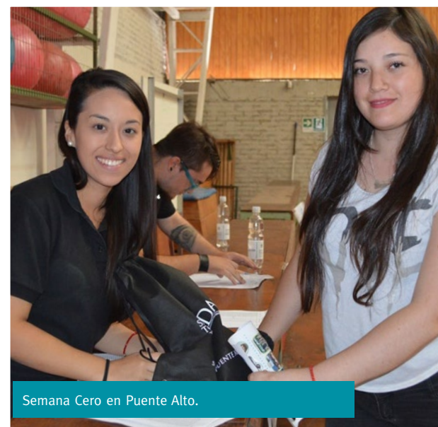
Semana Cero en Puente Alto.