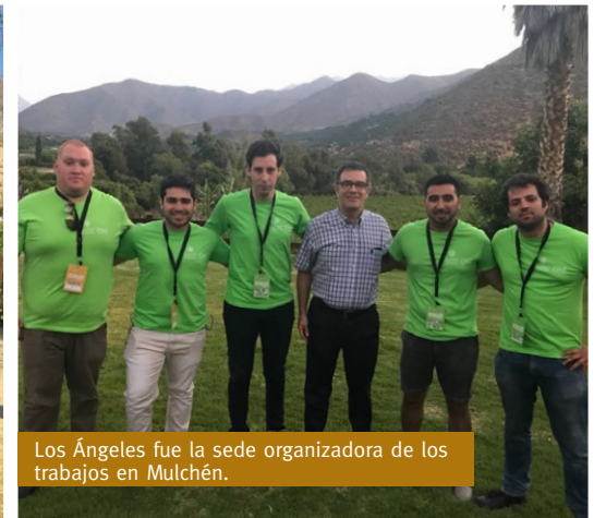
Los Ángeles fue la sede organizadora de los trabajos en Mulchén.