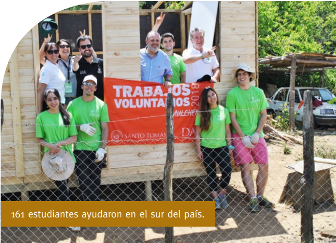
161 estudiantes ayudaron en el sur del país.