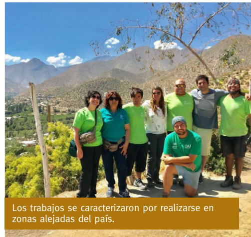
Los trabajos se caracterizaron por realizarse en zonas alejadas del país.