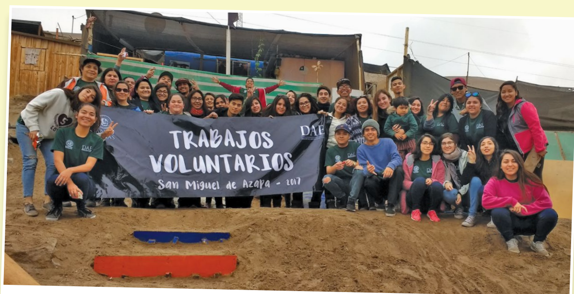
Tomasinos compartieron con las familias de San Miguel de Azapa en su voluntariado.

Esta acción social espera continuar a inicios del próximo año cuando se realicen los Trabajos Voluntarios de Verano 2018, que reunirán a alrededor de 250 alumnos en dos zonas divididas por norte y sur del país.