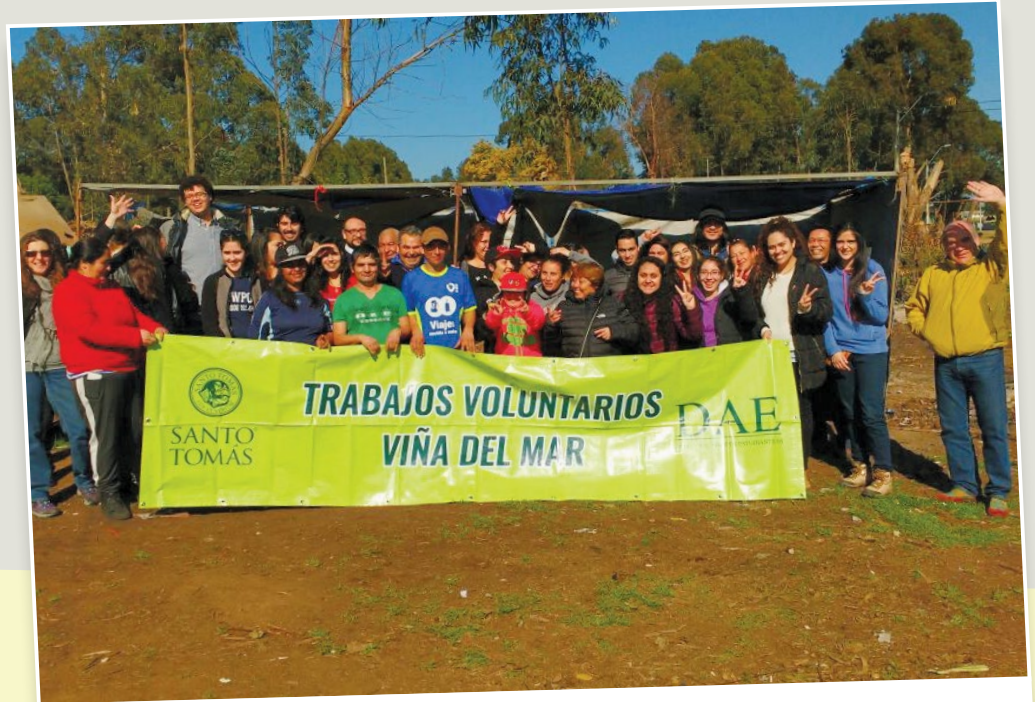
Los voluntarios junto a parte de las 83 familias que integran la toma Lomas del Bosque.