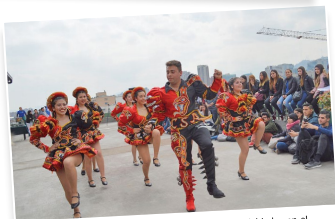
Los bailes típicos fueron parte importante de las actividades en el IP-CFT Santiago.