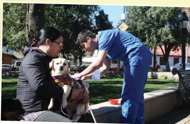
En Alhué, un grupo de alumnos de Medicina Veterinaria desparasitó a las mascotas del lugar.