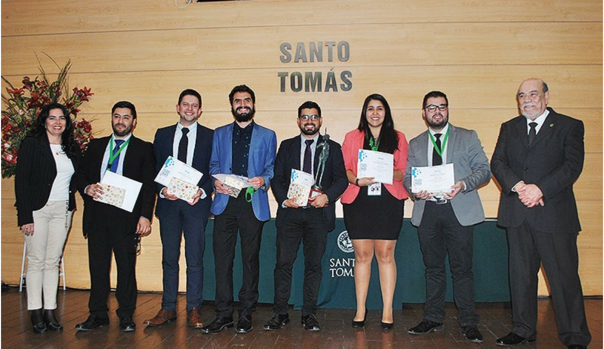
El Equipo I de Santo Tomás Viña del Mar se coronó campeón de la competencia.