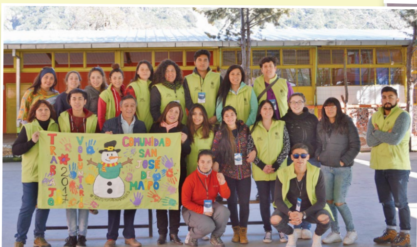
Durante una semana los alumnos de las sedes de Puente Alto, San Joaquín y Rancagua realizaron labores de limpieza en el Cajón del Maipo.