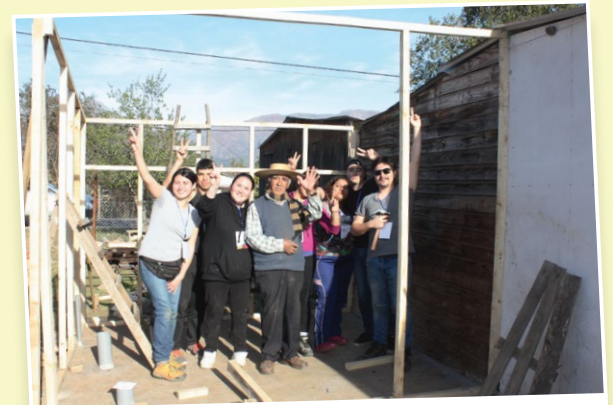
Instalación de baños y arreglos de techumbre fueron parte de las acciones desarrolladas en la localidad de Alhué.