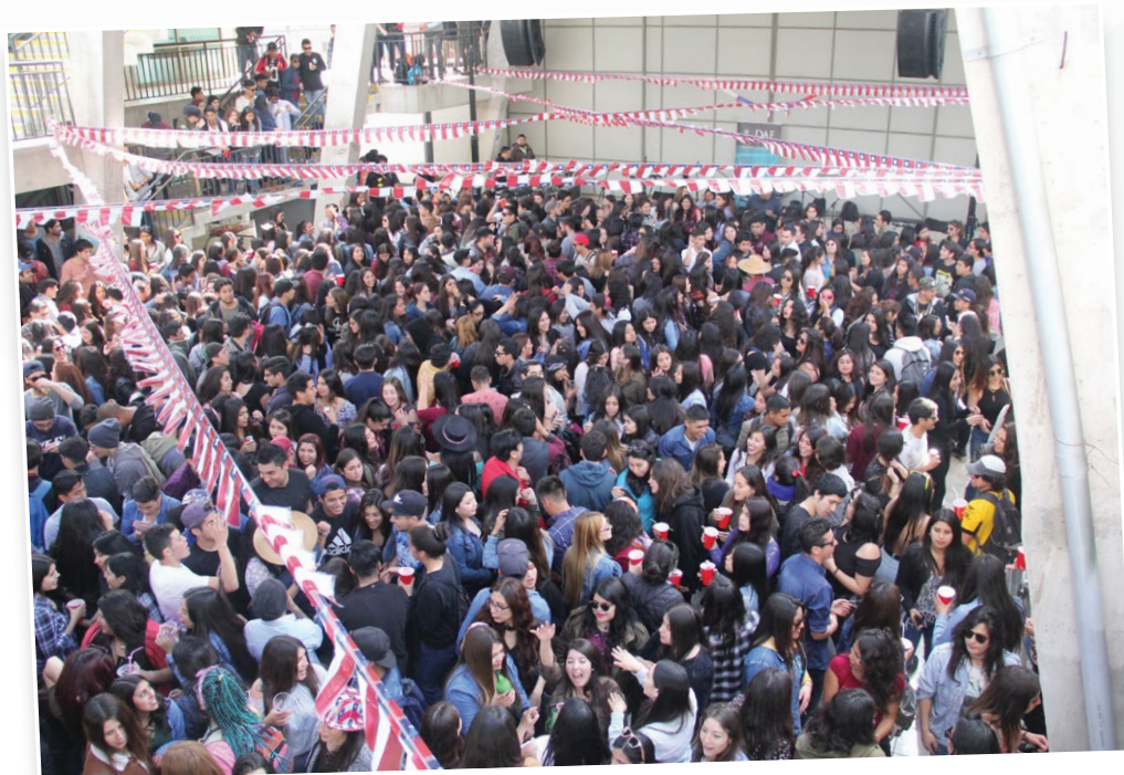
En La Serena, los jóvenes bailaron al ritmo de la cumbia y la pachanga.