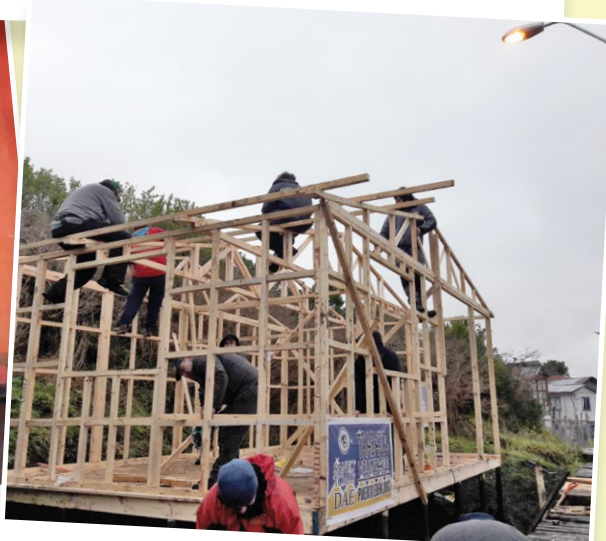
Unas de las acciones desarrolladas en Puerto Edén fue la construcción y el mejoramiento de cabañas y pasarelas.