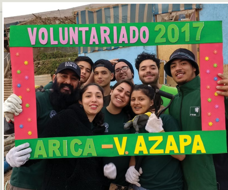
La localidad ubicada en el Valle de Azapa fue uno de los sectores que recibió ayuda de los estudiantes de Santo Tomás.

Con éxito se realizaron las jornadas de ayuda social desplegadas en nueve zonas rurales que fueron seleccionadas por sus altos índices de vulnerabilidad.