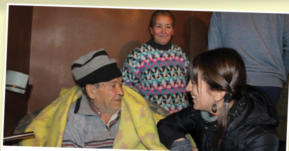
El Almendro, La faja Puypuyén, sector Abanquill y Bajo Esmeralda, fueron algunos de los sectores en Yervas Buenas donde realizaron los trabajos.