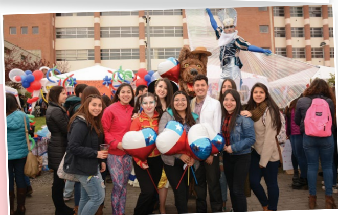
En un evento colorido se congregaron más de tres mil alumnos de Santo Tomás Concepción.