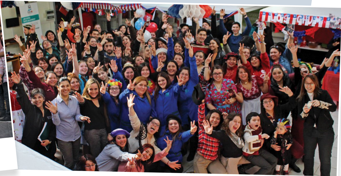
La mejor empanada, paya y pareja de cueca, fueron algunos de los concursos que se realizaron en Punta Arenas.