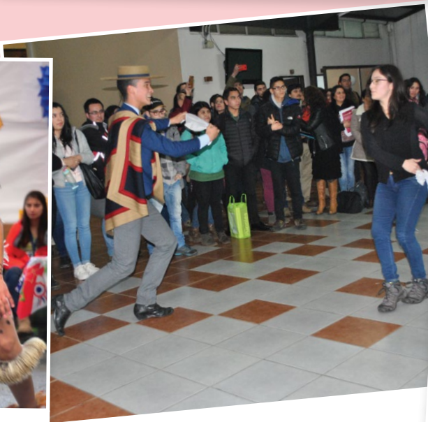
En Osorno disfrutaron del baile nacional.