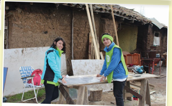
En la Región del Maule, los alumnos de Santo Tomás Curicó, Talca y Chillán, participaron del voluntariado.