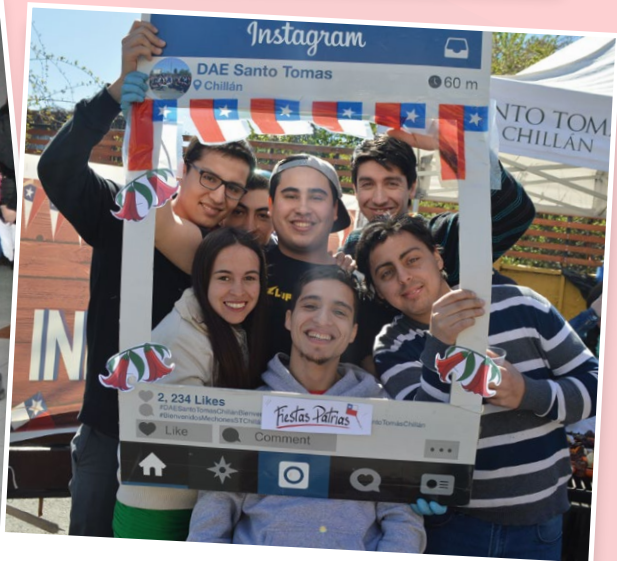
En Chillán se dispusieron stands de choripanes y juegos típicos.