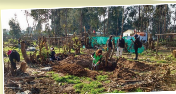
En Quintero, los tomasinos se preocuparon del mejoramiento de distintos espacios públicos.