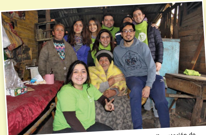
En Yervas Buenas, se ayudó en la higiene, abrigo y alimentación de los más necesitados.