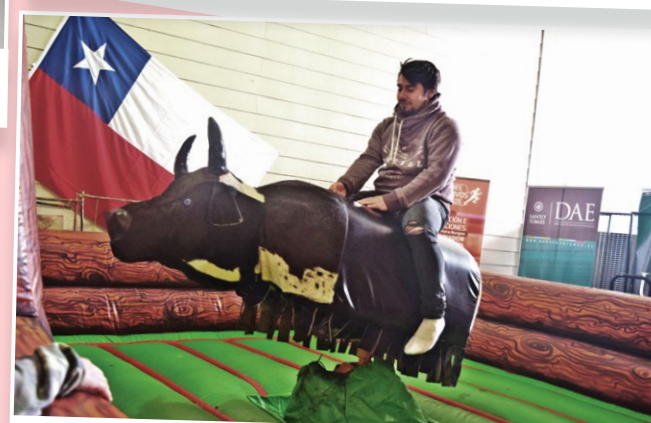
En Puerto Montt celebraron el 18 con juegos y comida tradicional.