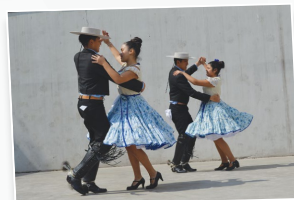
Huasos y chinas bailando en la sede San Joaquín.