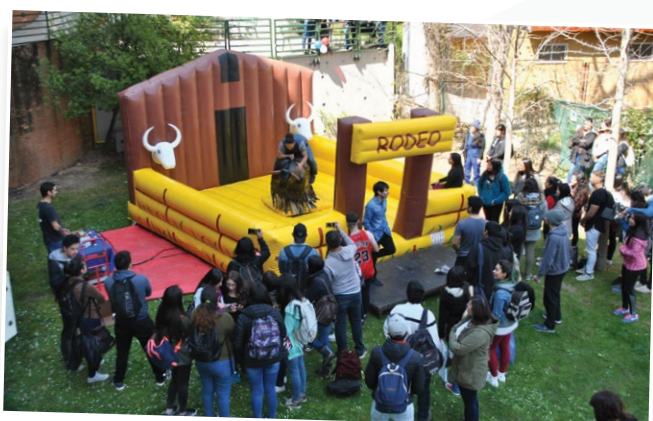
En Viña del Mar, los tomasinos jugaron a mantenerse durante el mayor tiempo posible en un toro mecánico.