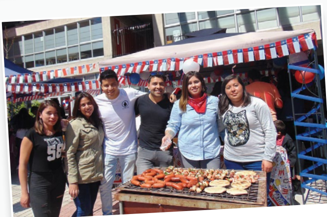
Anticuchos y choripanes degustaron los alumnos de Ovalle.