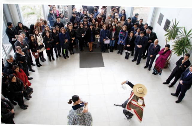
En Talca, las celebraciones se desarrollaron en el marco de la inauguración del nuevo edificio y casino en el Campus CAR.