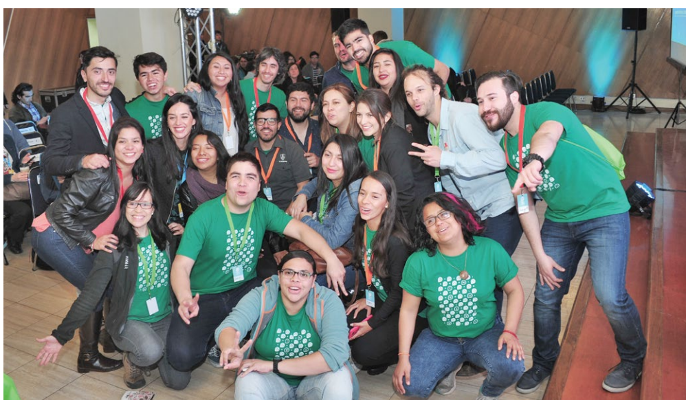
Al evento asistieron los agentes de cambio o fellows, provenientes de distintos países del mundo.

Balloon Summit 2017 buscó ser una oportunidad para que los alumnos de Santo Tomás se integraran al debate de la innovación social. Durante diciembre, la UST becará a seis alumnos para que participen en Balloon Internacional y sean parte de la red de agentes de cambio que promueven el emprendimiento en distintas regiones del mundo.