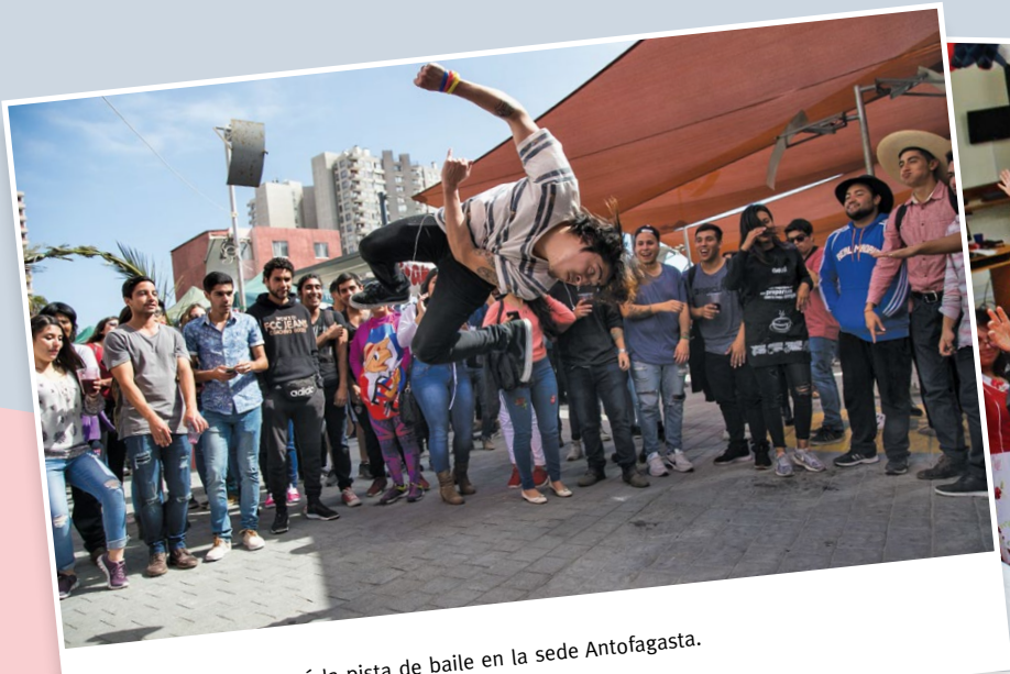
El breakdance se tomó la pista de baile en la sede Antofagasta.

Asimismo, en cada sede se realizaron diversas acciones destinadas a fomentar las tradiciones chilenas, entre ellas, los concursos a la mejor empanada, fonda y pareja de cueca; juegos criollos como tirar la cuerda y lanzar el aro; choripanadas; música con presentaciones en vivo y pista de baile.