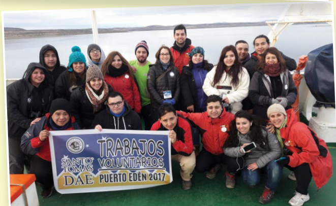
23 estudiantes trabajaron en Puerto Edén, un conjunto de islas donde viven 31 familias.