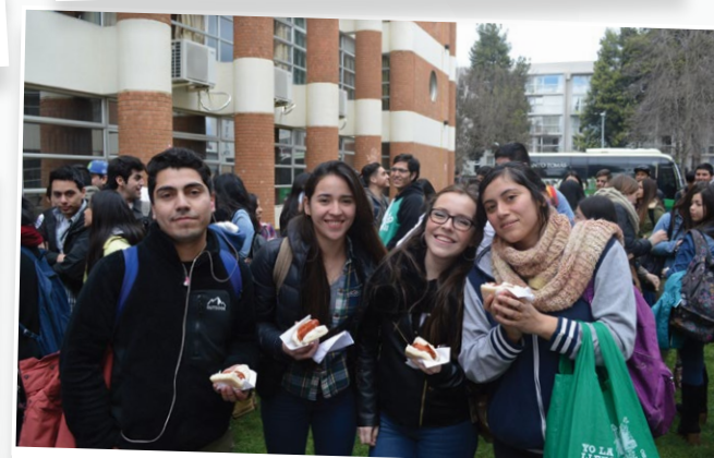
Cerca de 200 alumnos participaron en las fondas de la sede Temuco.