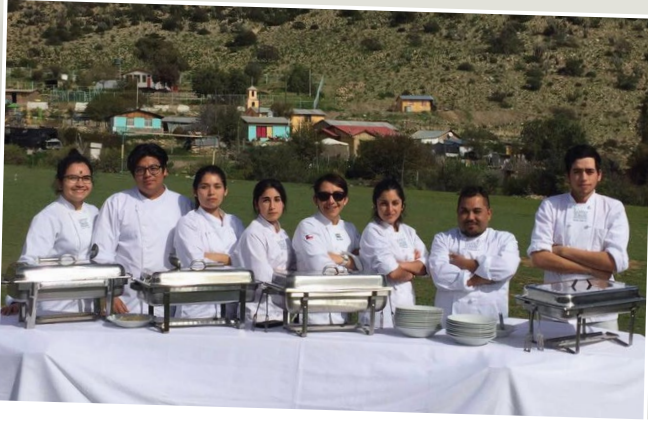
Estudiantes de Gastronomía ayudaron en Punitaqui.