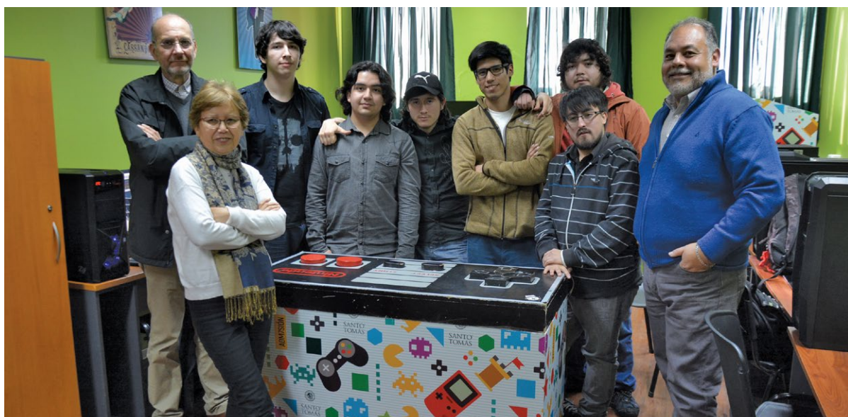
Los estudiantes de Santo Tomás junto al Comité Evaluador de Investigación, Neurociencia, Educación y Diseño de (i)Ned Consultores.

Dicho concurso se inició con una charla de expertos en Neurociencias de (i)Ned y luego, continuó con la conformación de equipos de trabajo que incluyeron la participación de un docente guía y aportes de otros estudiantes de Diseño e Informática. La primera etapa concluirá con la selección de un demo y con el desarrollo del juego en su totalidad en diciembre de 2017.