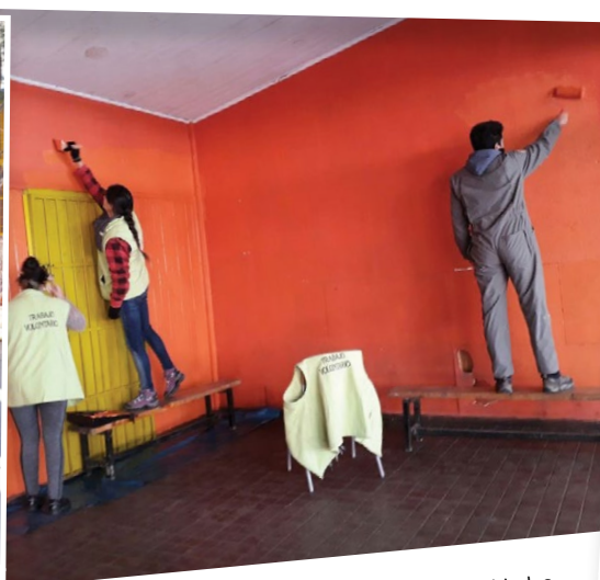
Pintar el Colegio El Manzano fue una de las actividades que se ejecutaron en San José de Maipo.