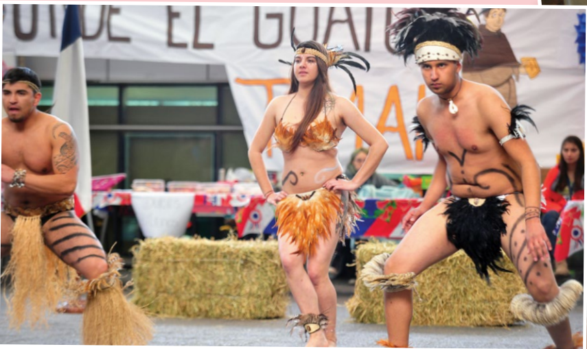
Los tomasinos de la capital bailaron el “Sau sau” de la Isla de Pascua.