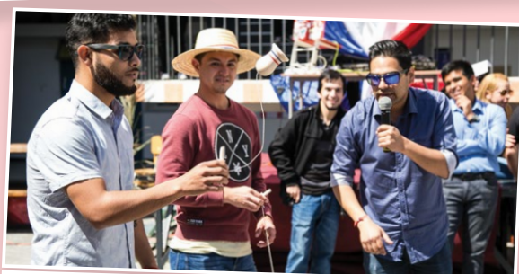
Antofagastinos jugando al emboque.