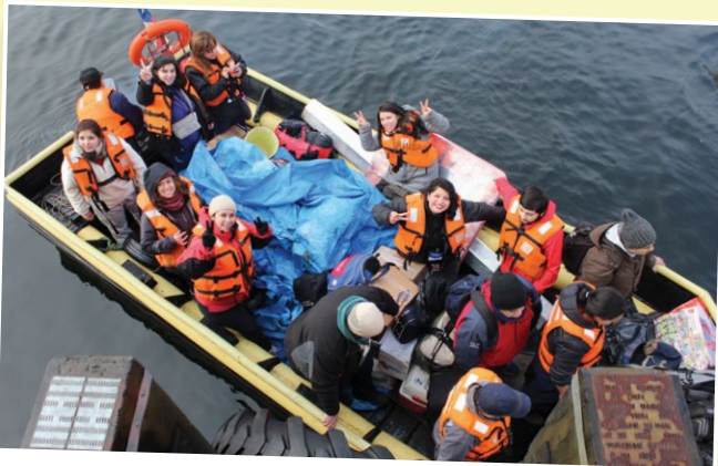
Los voluntarios viajaron 24 horas en una barcaza desde Puerto Natales a Puerto Edén, para luego asistir a las distintas islas de la localidad.