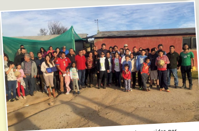
Las localidades Divisadero y Las Cruces fueron intervenidas por estudiantes de Santo Tomás Copiapó, Ovalle y La Serena.