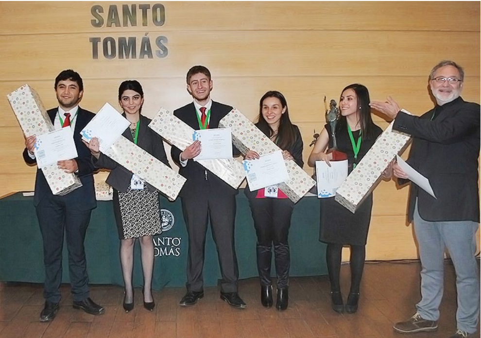
El equipo de Los Ángeles consiguió el segundo lugar del torneo.