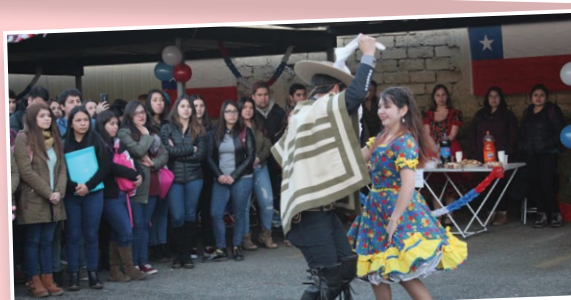
Más de un pie de cueca bailaron los estudiantes en Valdivia.