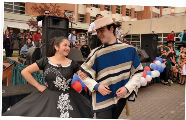
La cueca fue uno de los bailes que se realizó en la fiesta penquista.